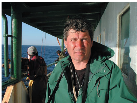
Портрет начальника морской экспедиции по проекту ISIP, НИС «Океан», август 2001 г., фото В.Г. Тарасова.

Head of a marine expedition of the International Sakhalin Island Project, R/V Okean , August 2001, photo by V.G. Tarasov.