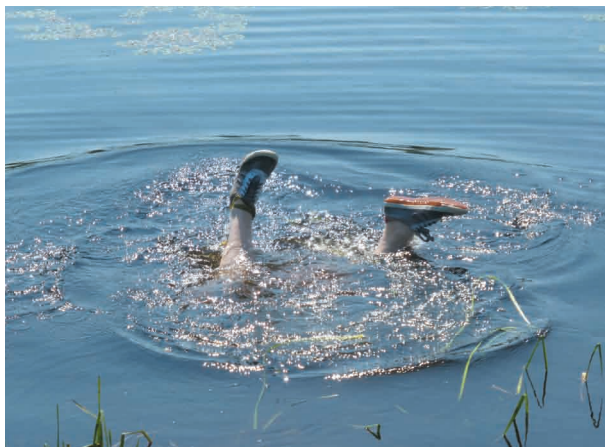
Сбор моллюсков со дна озера в басс. р. Комаровка, 6 августа 2015 г.