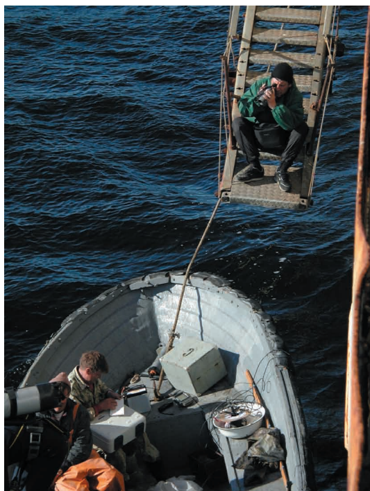
Сложные моменты морской экспедиции, НИС «Океан», август 2001 г., фото В.Г. Тарасова.

Head of a marine expedition of the International Sakhalin Island Project, R/V Okean , August 2001, photo by V.G. Tarasov.